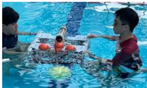
前回の水中ロボット競技会の様子

本大会では3部門が設定されており、各チームが作り上げた水中ロボットの性能と、その操作技術を競う熱い戦いを観戦できます。