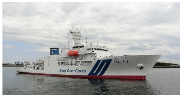
「平洋」：画像の展覧「海上保安庁」

海底地形や地質に関する調査を行う海上保安庁の大型測量船「平洋」。最新鋭のマルチビーム測深器などが搭載された、日本の海を守る重要任務を担う船です。2020年1月、約20年ぶりに就役され、船内の一般公開は今回が初めて！通常は入ることのできない操舵室や観測室では、観測機器等のほか、音波探査やマルチビーム測深器の実際の操作現場が見学できます。ほか、パネル・模型展示や、海上保安庁のマスコットキャラクター「うみまる」との写真撮影会も開催。