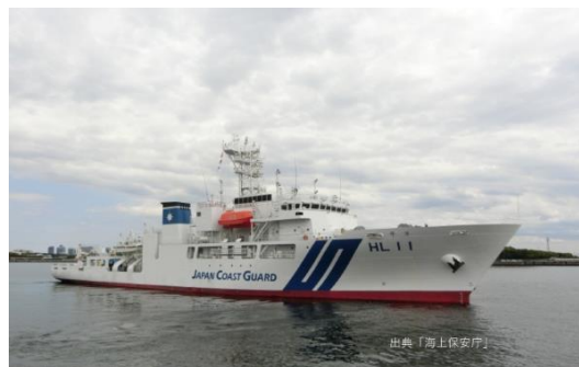
海上保安庁の測量船「平洋」

このプログラムでは、このたび全国初公開される海上保安庁の大型測量船「平洋」船内見学のほか、普段は目にすることができない施設を、解説付きで見学。最新の機器や海の世界に、一度に触れることができる貴重な機会です。