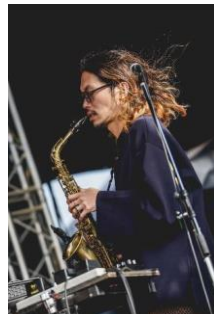
S. S. C. Q.