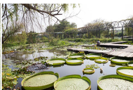
蓮荷園レジャー農園のオオオニバス水上漂体験では、葉に乗る体験ができる