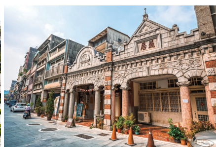
バロック様式の建物と上部に施された装飾が美しい大溪（ダーシー）地区