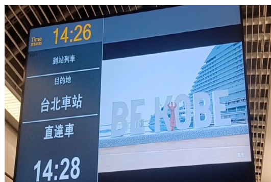
桃園メトロ内で神戸のプロモーションビデオを放映している様子

※当日の締結の様子につきましては、下記より写真ダウンロードが可能です。ご自由にご利用ください。