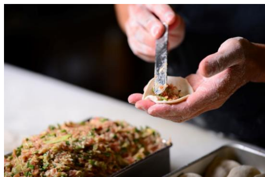
餃子作り体験(イメージ)

3 代目社長が語る餃子トリアビアなど餃子に関するお話の後は、満州式餃子作り体験で「皮作り」と「餃子包み」を体験していただきます。作った餃子の試食に加え、神戸ビーフ餃子等の餃子食べ比べなど、餃子好きにはたまらない盛りだくさんの内容です。