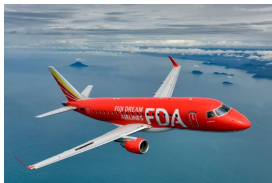
FDA 遊覧フライト(イメージ)

お土産には特別搭乗証明書に加え、FDAグッズ（非売品）と神戸ルミナリエオリジナルグッズをプレゼントします