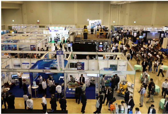
過去の展示会の様子