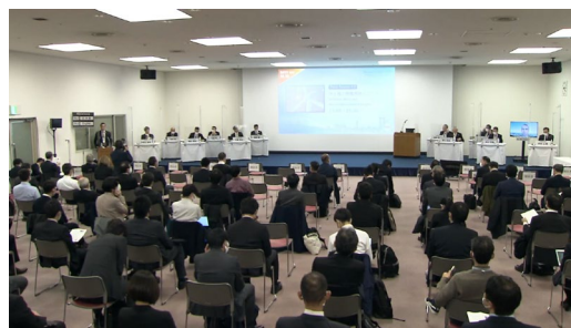
過去のパネルセッションの様子