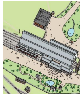
明治 7 年～9 年頃の神戸駅を再現した鳥瞰図（部分抜粋） © AOYAMA Daisuke