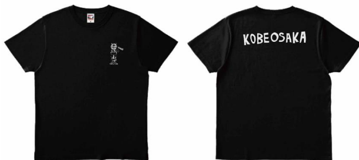
描きおろしロゴ (イメージ)