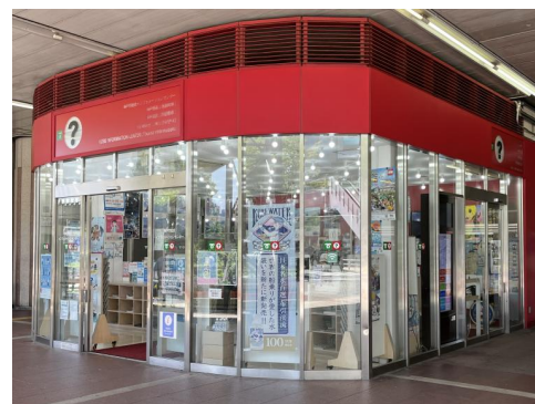
神戸市総合インフォメーションセンター