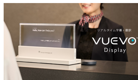
VUEVO Display イメージ