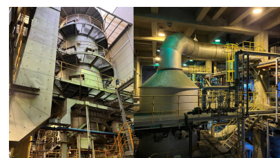
苅藻島クリーンセンター