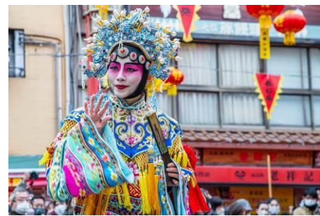
中国史人游行（イメージ）