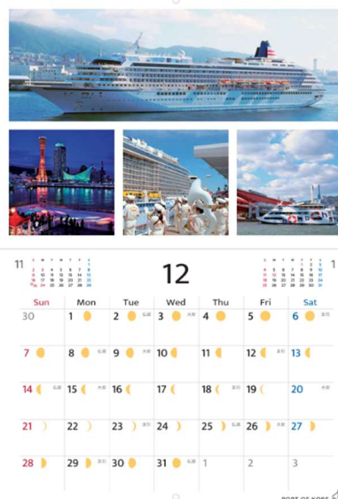
昨年度発行した「2025 年神戸港カレンダー」（左／表紙、右／中面）