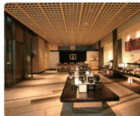
図 水・木曜 月 11:00~18:00 図 JR琵琶湖線「山科駅」から徒歩約10分、または京阪京津線「四宮駅」から徒歩約1分 ※相互直通運転の地下鉄東西線京都駅市街へ乗換えてアクセス可能

四条通沿いの地下1階、地上9階建ての施設では、フロアごとにコンセプトを掲げ、京都に息づく王朝文化と宇治茶の世界を展開。各種体験やお茶の料理も堪能できます。