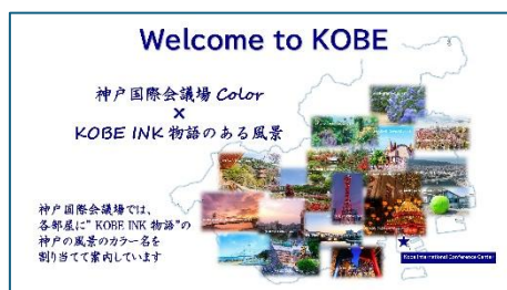
ロビー・エレベーター前の案内