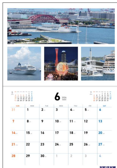
2026 年神戸港カレンダー（上/表紙、右/中面）