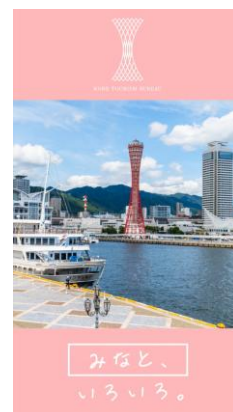
神戸観光 PR 映像の一例

放映内容：神戸ルミナリエ、ウォーターフロント、BE KOBE モニュメント 登山、南京町、北野、有馬温泉、神戸ビーフ等（合計 12 種類）