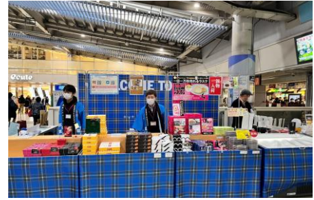
ブースのイメージ