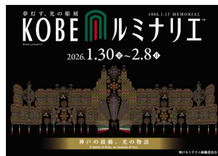
神戸ルミナリエのポスター