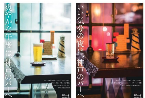
神戸バーに誘うポスター

「コウベ de ナイト」HP： https://www.feel-kobe.jp/kobe-yakei/bar/