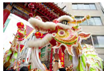
「南龍游行」（龍のパレード）