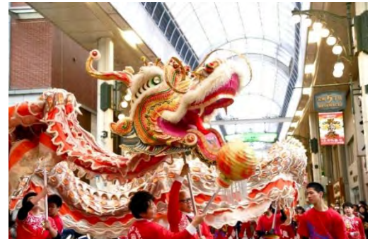
※写真は過去のパレードの様子