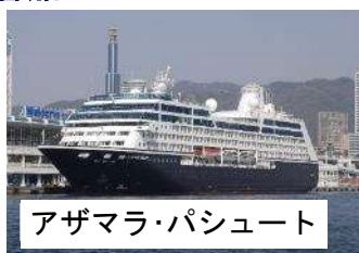
アザマラ・パシュート