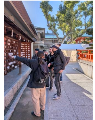
外国人モニターに英語で観光案内を行う学生の様子（昨年度）

また、講座の修了者は、クルーズ乗船客の観光案内を担うおもてなしクルーとして登録してもらうなど学んだ知識を実践に活かす仕組みを整えています。さらに、2024年度の修了生が、本講座の受講をきっかけに設立したインバウンド向けのガイド運営会社「LinkRoots（リンクルーツ）」へ登録も進んでおり、本事業を通じて、神戸の着地型体験を支える新たな担い手の育成にもつながっています。