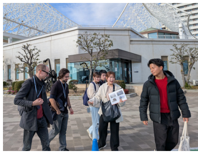
外国人モニターガイドツアーの様子