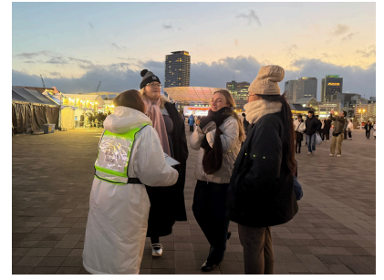
ルミナリエでの多言語対応の様子