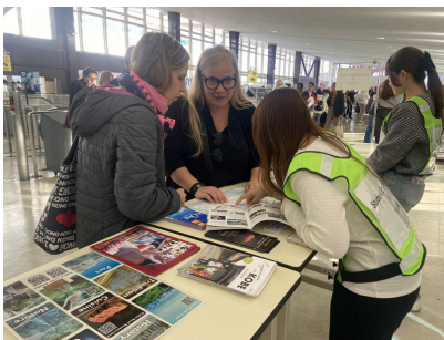
ポートターミナルでの客船向け観光案内の様子