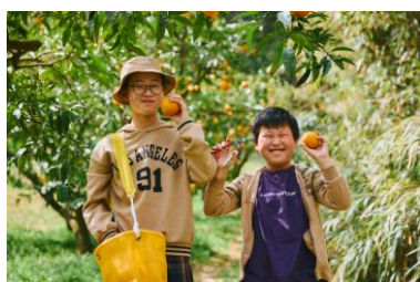
淡路島なるとオレンジ収穫体験