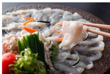
淡路島3年とらふぐ