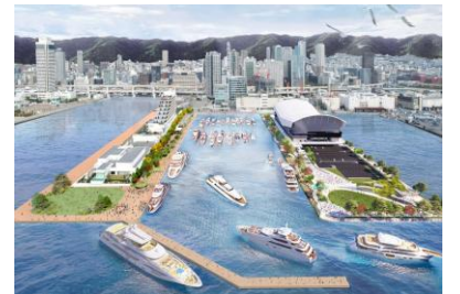
SUPERYACHT BASE KOBE (©畑友洋建築設計事務所)