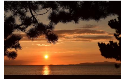
淡路島・慶野松原の夕日